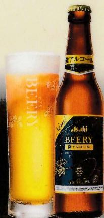
ビールテイスト飲料(アルコール分0.5%)